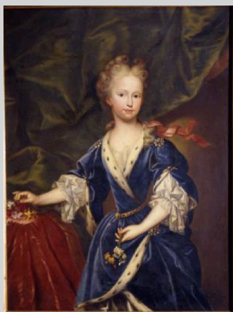
Giovanni Maria delle Piane detto il Mulinareto, Ritratto di Elisabetta Farnese giovanetta , 1706 olio su tela, 115 x 86 cm Parma, Complesso Monumentale della Pilotta, Galleria Nazionale