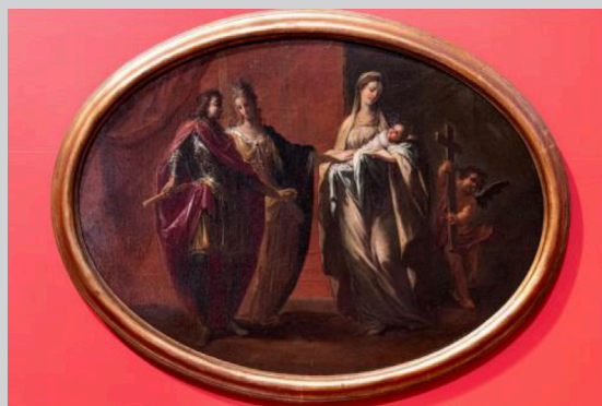
Ilario Giacinto Mercanti detto Spolverini Filippo V ed la regina Elisabetta Farnese osservano l'Infante Carlo in braccio alla Fede, 1716 ca. olio su tela ovale, cm 76x101 Musei Civici di Palazzo Farnese, Piacenza