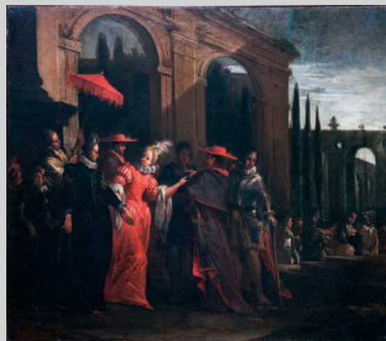
Ilario Giacinto Mercanti detto Spolverini Elisabetta Farnese e la madre Dorotea Sofia incontrano i cardinali Gozzadini e Acquaviva accompagnate da alcuni gentiluomini, 1717 olio su tela, cm 109x124 Musei Civici di Palazzo Farnese, Piacenza