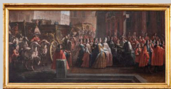
Ilario Giacinto Mercanti detto Spolverini Il vescovo e il clero di Parma rendono omaggio a Elisabetta alla porta del Duomo, 1715-1717 olio su tela, 80x170 cm Reggia di Caserta, Collezione Farnese, Serie dei Fasti Farnesiani, nozze di Elisabetta Farnese e Filippo V