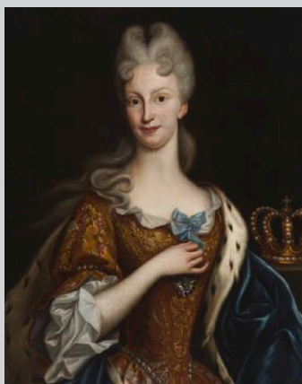
Giovanni Maria delle Piane detto Mulinareto, Ritratto di Elisabetta Farnese , 1714 -1715 olio su tela, 71,7 x 88 cm Reggia di Caserta, Collezione Farnese, Serie dei Fasti Farnesiani, nozze di Elisabetta Farnese e Filippo V

Cartella stampa e foto disponibili al link: https://www.electa.it/ufficio-stampa/i-fasti-di-elisabetta-farnese-ritratto-di-una-regina/