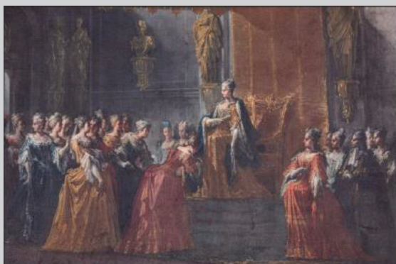
Ilario Giacinto Mercanti detto Spolverini Baciamano della regina Elisabetta da parte delle dame e dei gentiluomini di Corte, 1717 - 1718 olio su tela, 95x165 cm Reggia di Caserta, Collezione Farnese, Serie dei Fasti Farnesiani, nozze di Elisabetta Farnese e Filippo V