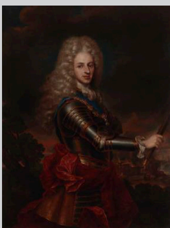
Nicolò Maria Vaccaro, Ritratto di Filippo V, re di Spagna , 1715 olio su tela, 136,5 x 105 cm Piacenza, Collegio Alberoni