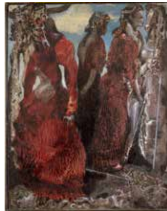
L'angelo del focolare , 1937 Olio su tela, 114 x 146 cm Collezione privata, Svizzera © Max Ernst by SIAE 2023