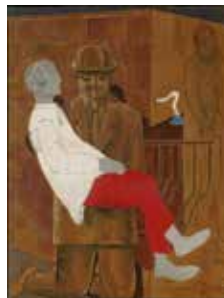
Gli uomini non ne sapranno nulla , 1923 Olio su tela, 80,3 x 63,8 cm Tate, acquisito nel 1960 © Tate, London, 2023 © Max Ernst by SIAE 2023