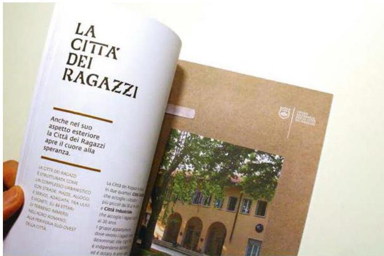
Pag. 131 Progetto di identità visiva per La Città dei Ragazzi