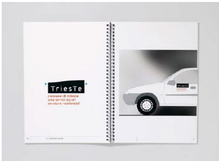
Pag. 56 Manuale di immagine coordinata del Comune di Trieste realizzata dallo Studio Tassinari/Vetta dal 1996 al 2000.