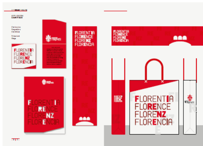
Pag. 143 Ipotesi di sviluppo e di applicazione del progetto di city brand di Firenze