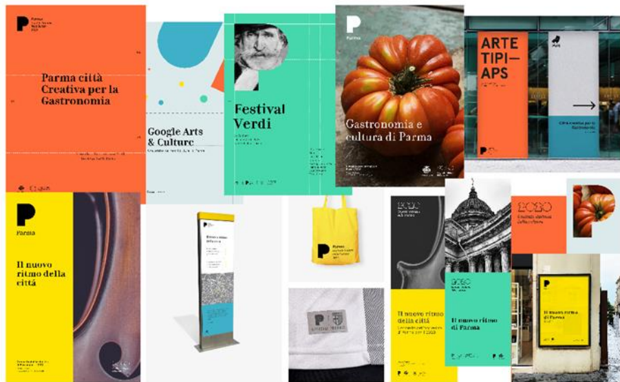
Pagg. 26-27 Esplorazioni visive del nuovo logo di Parma