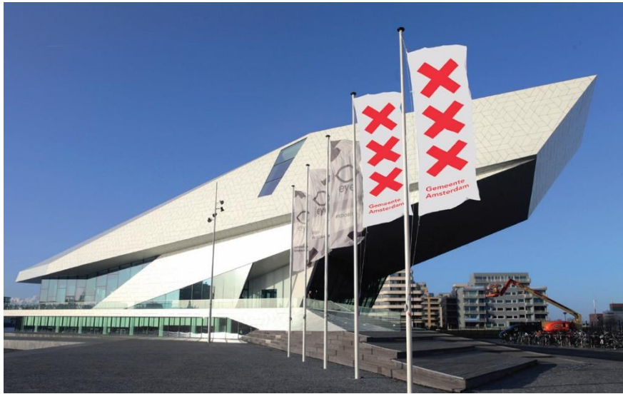
Pagg. 214-215 Progetto di immagine coordinata per la città di Amsterdam