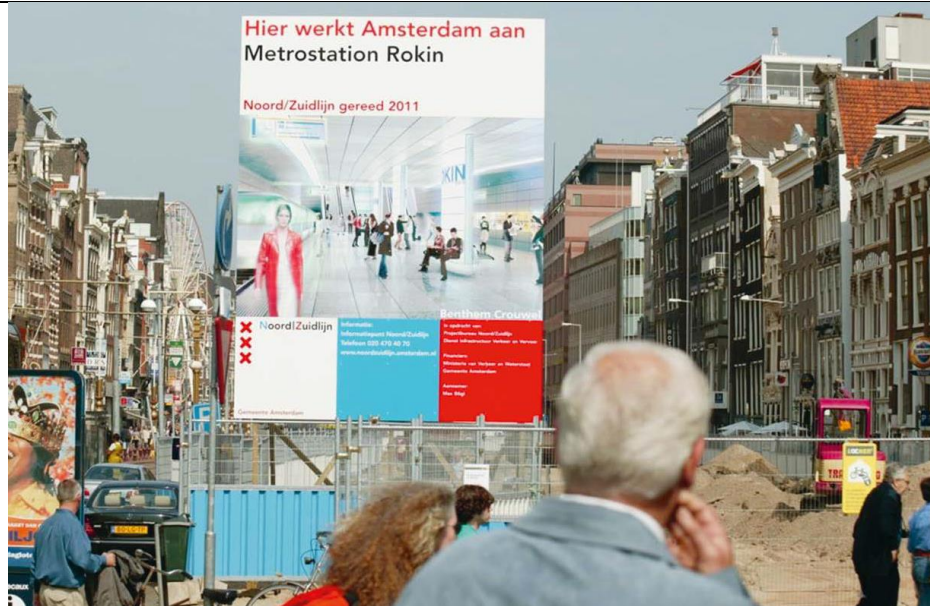
Pagg. 224-225 Progetto di immagine coordinata per la città di Amsterdam