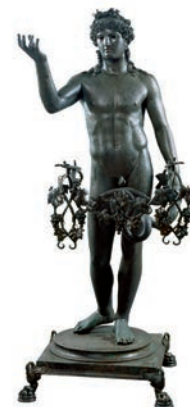
Efebo portalucerna I secolo d.C. Bronzo Casa di Marco Fabio Rufus (VII 16, 19), salone Su concessione del Ministero per i Beni e le Attività Culturali e per il Turismo - Parco Archeologico di Pompei