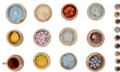
Coppette contenenti i pigmenti impiegati per le decorazioni parietali I secolo d.C. Pompei