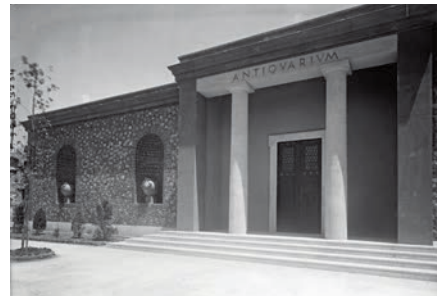
1948, Pompei, Antiquarium, facciata.