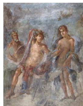
Dioniso e Arianna a Nasso Età neroniana (54-68 d.C.) Affresco Casa del Bracciale d'oro (VI 17, 42), triclino