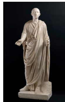
Statua funeraria di togato Prima metà del I secolo d.C. Marmo Necropoli di Porta Ercolano, Tomba degli Istaecidi