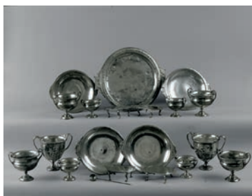
Servizio da tavola in argento composto da 20 pezzi (3850 grammi) che comprende: un piatto da portata circolare, quattro piatti, dieci coppe di cui due decorate a sbalzo, 4 supporti, un cucchiaino Età augustea Argento Pompei, Complesso dei Triclini in Località Moregine Su concessione del Ministero per i Beni e le Attività Culturali e per il Turismo - Parco Archeologico di Pompei