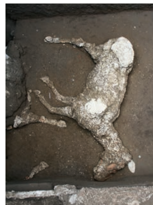
Copia di calco di cavallo dallo scavo di Civita Giuliana Poliuretano Boscoreale, Civita Giuliana