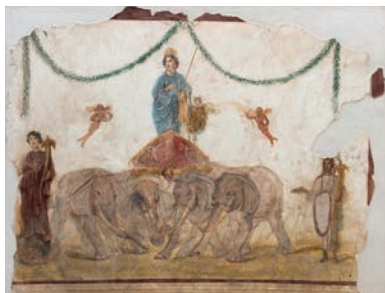
La dea Venere su una quadriga trainata da elefanti I secolo d.C. Affresco Officina dei Feltrai (IX 7, 5)