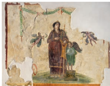
Venere Pompeiana con erote I secolo d.C. Affresco Taberna delle Quattro divinità (IX 7, 1)