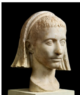
Ritratto di Marcello Prima metà I secolo d.C. Marmo Scarichi sotto la Casa di Championnet (VIII 2, 1)