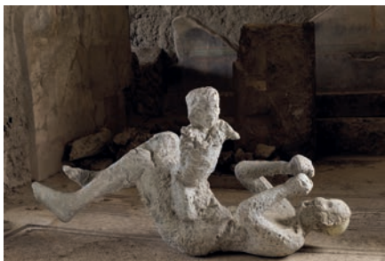
Calco di uomo con bambino Gesso Casa del Bracciale d'oro (VI 17, 42)