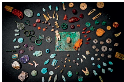
Tesoro di amuleti I secolo d.C. Bronzo Casa con Giardino (V, 2)