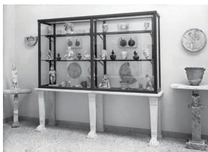
1948, Pompei, Antiquarium, sala IV, esposizione Su concessione del Ministero per i Beni e le Attività Culturali e per il Turismo - Parco Archeologico di Pompei