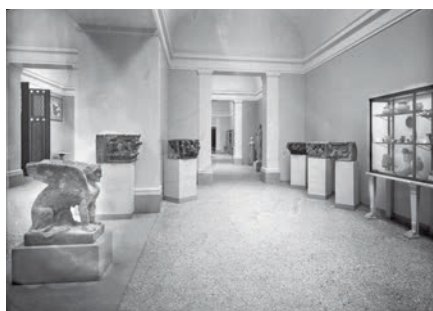
1948, Pompei, Antiquarium, sala II, esposizione