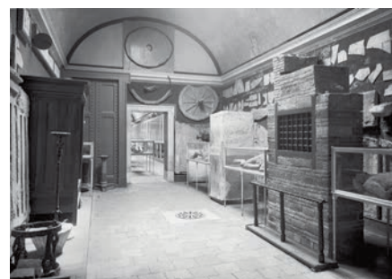
1914, Pompei, Antiquarium, sala II, esposizione Su concessione del Ministero per i Beni e le Attività Culturali e per il Turismo - Parco Archeologico di Pompei