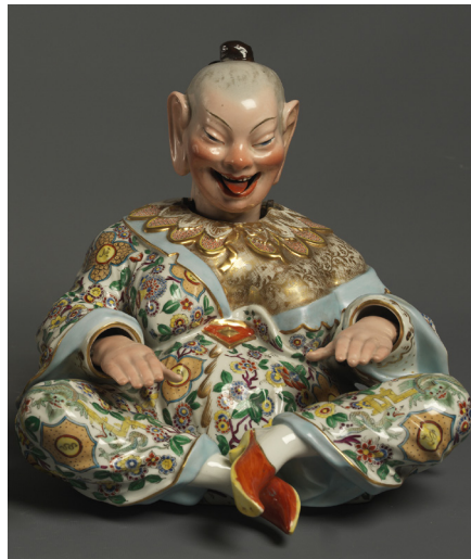
Manifattura di Meissen (1710 ad oggi) Idolo cinese, detto "pagoda" seconda metà del XVIII secolo Porcellana dipinta e dorata

Costumi: Festa teatrale (Prima rappresentazione: Napoli, Teatro di San Carlo, 4 novembre 1987) Autori vari del Settecento Inaugurazione Stagione Lirica 1987-1988 Celebrazione del 250° anniversario del Teatro di San Carlo (Fondazione: 4 novembre 1737) Teatro di San Carlo Direttore d'orchestra: Gustav Kuhn Regia: Roberto De Simone Scene: Mauro Carosi Costumi: Odette Nicoletti Orchestra e Coro del Teatro di San Carlo MEMUS – Museo e Archivio Storico del Teatro di San Carlo