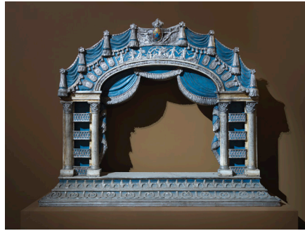
Maquette del Teatro San Carlo di Napoli

Anton Raphael Mengs (Aussig 1728 – Roma 1779) Ferdinando IV di Borbone all'età di nove anni, 1759 Olio su tela