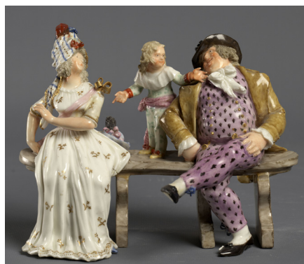
Real Fabbrica di Napoli (1771-1806) Gruppo borghese 1793-1800 circa Porcellana dipinta