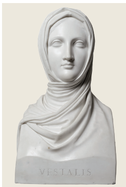
Antonio Canova Vestale , 1819 Marmo, 58 x 31 x 23 cm Milano, Galleria d'Arte Moderna