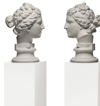
Giulio Paolini Mimesi , 1975 Calchi in gesso e basi bianche, due calchi h 37 cm ciascuno Torino, proprietà dell'artista