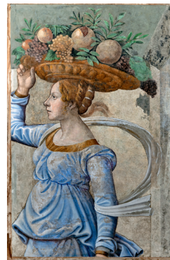
Ghirlandaio, copia da Canefora Fine del XV - inizio del XVI secolo (?) Affresco staccato, 121,5 x 77 x 4,7 cm Pisa, Museo Nazionale di San Matteo