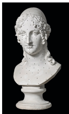
Antonio Canova Elena , 1811 Gesso, 69 x 35 x 30 cm Possagno, Museo e Gipsoteca Antonio Canova