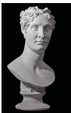
Antonio Canova Ritratto di Elisa Baciocchi Bonaparte , 1812 Gesso, 42 x 28 x 28 cm Possagno, Museo e Gipsoteca Antonio Canova