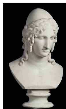
Antonio Canova Elena , 1819 circa Marmo, 64 x 39 x 30 cm San Pietroburgo, Museo Statale Ermitage