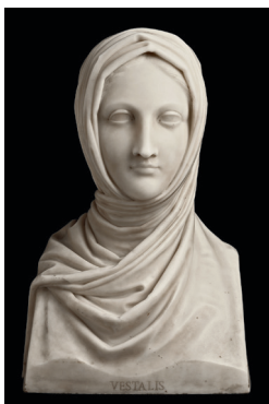
Antonio Canova Vestale , 1821-1822 Marmo, 49,8 x 31,9 x 24,1 cm Los Angeles, The J. Paul Getty Museum