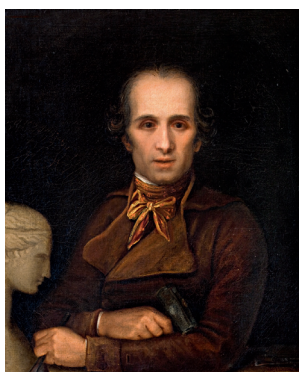
Antonio Canova Autoritratto come scultore , 1799 Olio su tela, 73 x 61 cm Possagno, Museo e Gipsoteca Antonio Canova

https://www.electa.it/ufficio-stampa/canova-i-volti-ideali/