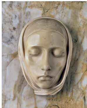
Adolfo Wildt Vergine , 1924 Marmo, 58 x 51 x 15 cm Milano, Pinacoteca di Brera