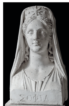
Antonio Canova Filosofia , 1818-1819 Gesso, 74 x 45 x 30 cm Possagno, Museo e Gipsoteca Antonio Canova