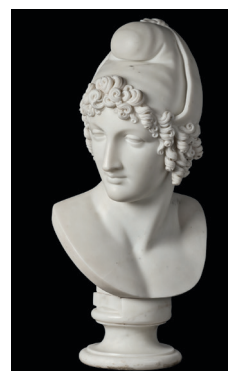
Antonio Canova Paride , 1819 circa Marmo, 68 x 32 x 26 cm San Pietroburgo, Museo Statale Ermitage