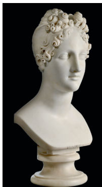
Antonio Canova Eleonora d'Este , 1819 Marmo, 45 x 25 x 21 cm Brescia, Pinacoteca Tosio Martinengo