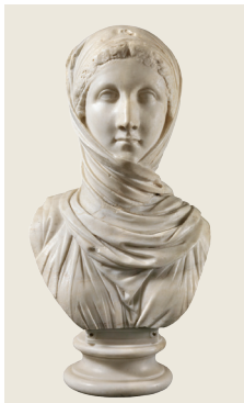
Busto femminile della cosiddetta Vestale (la "Zingarella") , I-III secolo d.C. Marmo, h 58,5 cm Napoli, Museo Archeologico Nazionale