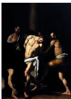
Caravaggio Flagellazione 1607

Le immagini sono disponibili al link https://www.electa.it/ufficio-stampa/caravaggio-napoli/