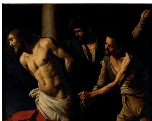
Caravaggio Flagellazione 1607

Olio su tela, cm 266 x 213 Napoli, Museo e Real Bosco di Capodimonte Su concessione del Fondo Edifici di Culto, Direzione Centrale del Ministero dell'Interno / Su concessione del Ministero per i Beni e le Attività Culturali: Polo Museale della Campania / foto di Luciano Romano