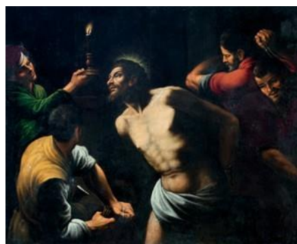
Fabrizio Santafede (attribuito) Flagellazione 1609 Circa

Olio su tela, cm 134,5 x 175,5 Rouen, Musée des Beaux-Arts