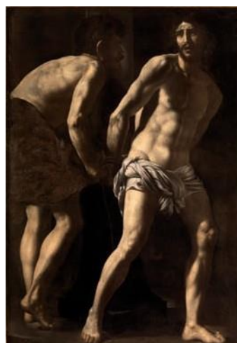
Giovann Battista Caracciolo detto Battistello Cristo alla Colonna 1618-1620 circa

Olio su tela, cm 128 x 155 Palermo, Galleria Regionale della Sicilia di Palazzo Abatellis