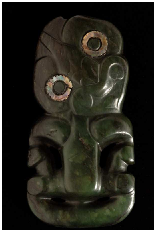
10. Hei-Tiki Pendente antropomorfo Oceania. Polinesia. Nuova Zelanda. Māori XIX secolo Nefrite e conchiglia, 13×6,5×1,7 cm © Lugano, MUSEC - Collezione Brignoni Inv. Oc.Pol.2.003