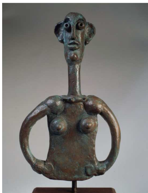
02. André Derain Femme au long cou , 1940 Bronzo 32×19,5×4 cm © Lugano, Collezione privata