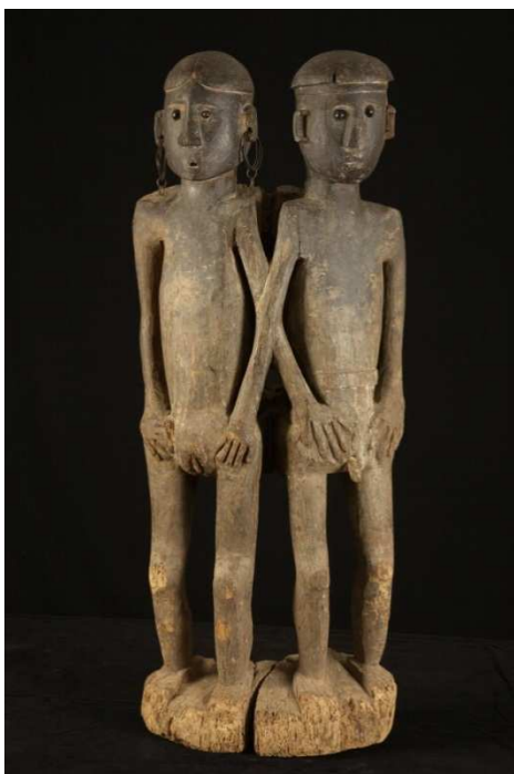
01. Scultura raffigurante una coppia di individui di alto rango Asia. Regione indiana. Nord-est. Nagaland Konyak Fine del XIX secolo Legno scolpito, semi e metallo, 105×42×20 cm ©Lugano, MUSEC - Collezione Brignoni Inv. As.Ind.2.001

Le immagini fornite possono essere utilizzate solo ed esclusivamente nell'ambito di recensioni o segnalazioni giornalistiche della mostra. Ogni immagine deve essere sempre accompagnata dalla propria didascalia con relativo copyright.