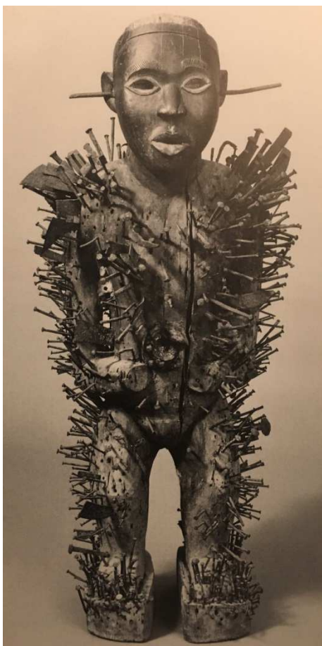
07. Nkisi Nkisi Statua magica Africa. Africa Centrale. Congo Legno, ferro e argilla, 94×44×30 cm © Zurigo, Völkerkundemuseum der Universität Zürich Inv. 10122