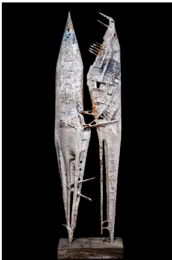
08. Raffaello Arcangelo Salimbeni Pace contrastata , 1956 Gesso e ferro, 280×68×24 cm © Firenze, Collezione privata Foto: Torquato Perissi