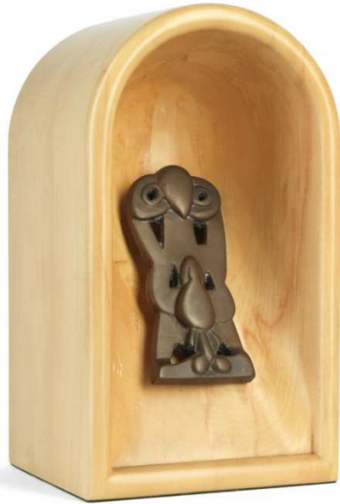
09. Henri Gaudier- Brzeska Doorknocker 1914 (1965) Bronzo, 17,1×7,9×2,9 cm