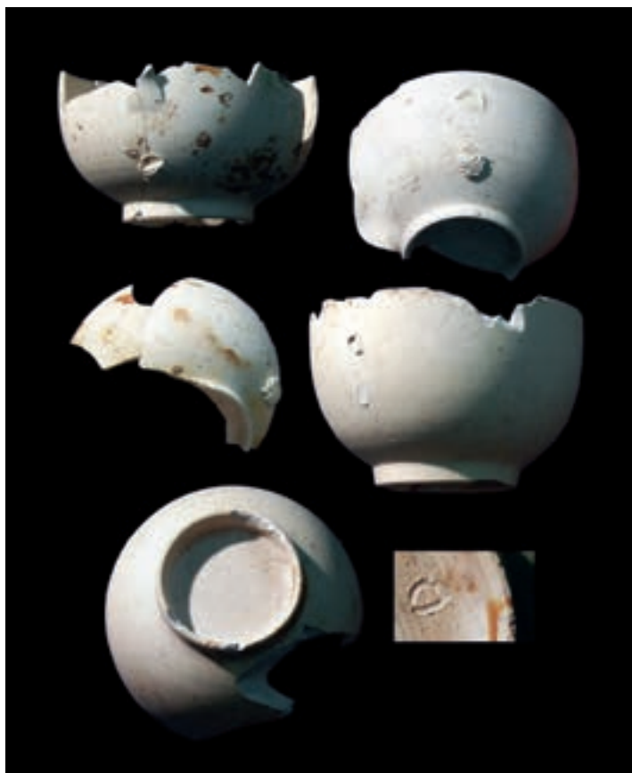
Fig. 1 Tazzine in biscuit (dallo scavo di via Urbana)