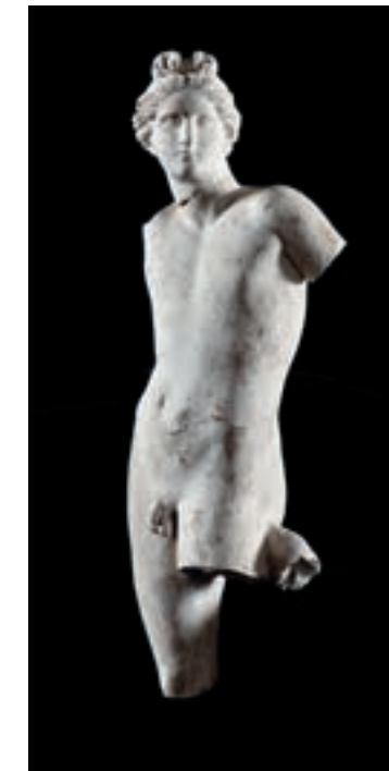
Fig. 6a Giovanni Volpato, Apollino (dallo scavo di via Urbana)