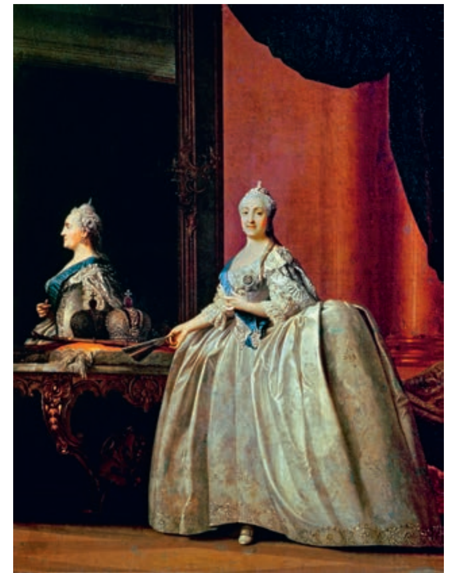
Fig. 5b Vigilius Erichsen, Caterina II allo specchio , 1779, olio su tela, San Pietroburgo, The State Russian Museum