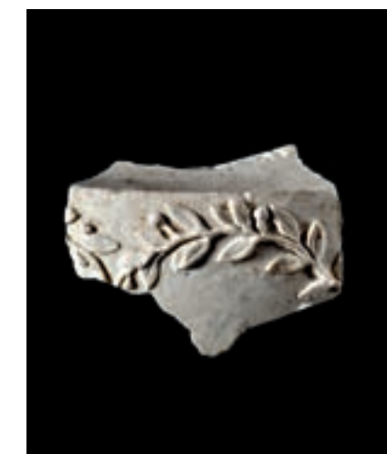
Fig. 11 Giovanni Volpato, Portuovo: egittizzante (a); con costolature (b) (dallo scavo di via Urbana)