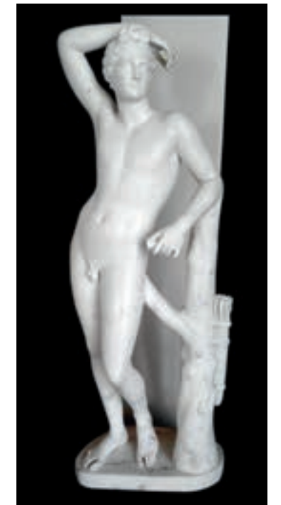
Fig. 6b Antonio Canova, Apollino conservato al Museo del Palazzo di Re Jan III a Wilanów in Polonia