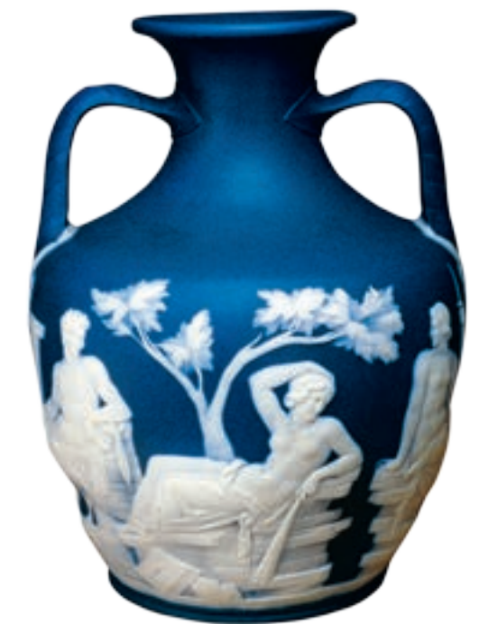
Fig. 10 Vaso di Portland, Londra, British Museum