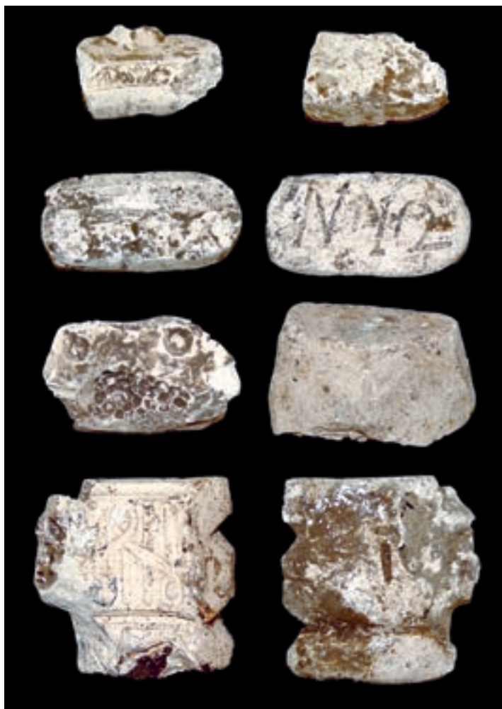
Fig. 2 Stampi in gesso (dallo scavo di via Urbana)