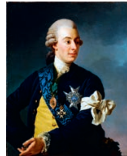
Fig. 5a Alexander Roslin, Gustavo III di Svezia con il bracciale della Libertà , 1772, olio su tela, cm 80 x 65, Stoccolma, Nationalmuseum