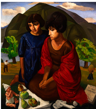
Achille Funi Il bel cadavere (Le villeggianti) 1912-1920 olio su tela, 112,5 x 100 cm Museo del Novecento, Milano Collezione Boschi Di Stefano