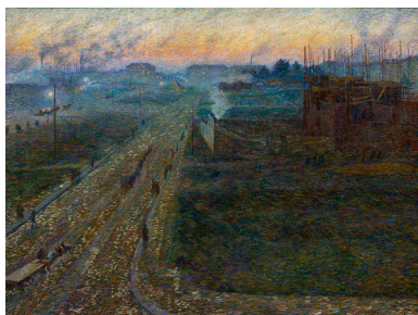
Umberto Boccioni Crepuscolo 1909 olio su tela, 90 x 120 cm Collezione privata