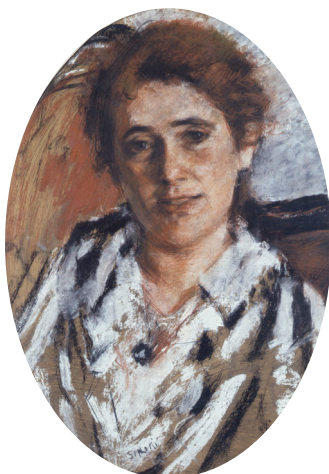
Mario Sironi Ritratto di Margherita Sarfatti 1916-1917 pastello e tempera su cartone 60 x 44 cm Collezione privata, Roma

Le immagini possono essere utilizzate solo ed esclusivamente nell'ambito di recensioni o segnalazioni giornalistiche delle mostre dedicate a Margherita Sarfatti, a Milano, Museo del Novecento e al Mart, Museo di arte contemporanea di Trento e Rovereto dal 21 settembre 2018 al 24 febbraio 2019