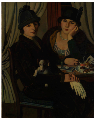
Piero Marussig Donne al caffè 1924 olio su tela, 100 x 80 cm Museo del Novecento, Milano