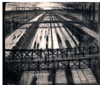
Mario Stroppa Viale tra Milano e Sesto San Giovanni 1909 carboncino su cartoncino, 53 x 57 cm Collezione privata