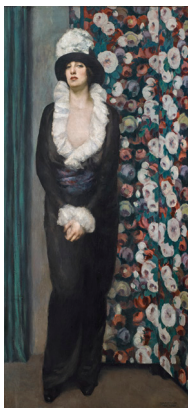
Gian Emilio Malerba L'attesa 1916 olio su tela, 190 x 87 cm