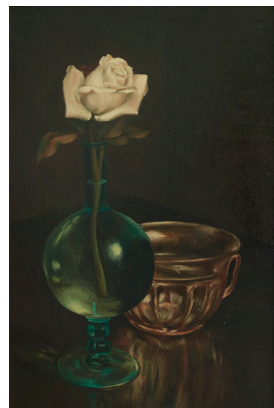
Ubaldo Oppi I vetri di Murano , 1925 olio su tavola, 54 x 37,5 cm Museo del Novecento, Milano