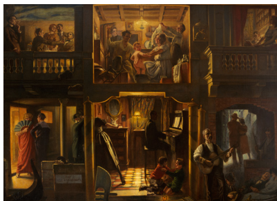
Leonardo Dudreville Amore: discorso primo 1924 olio su tela, 266 x 364 cm Collezione Fondazione Cariplo Milano