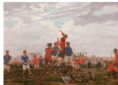
Leonardo Dudreville Partita di calcio (il gioco) 1924 olio su tela, 50 x 70,5 cm Museo del Novecento, Milano