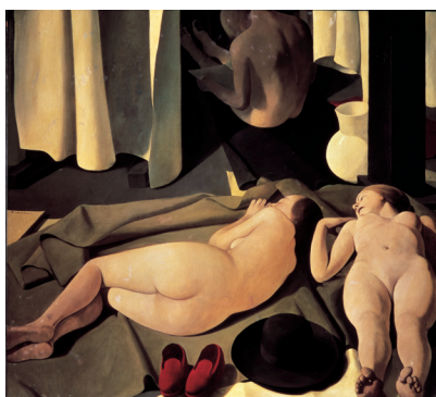
Felice Casorati Meriggio 1923 olio su tavola, 119,5 x 103,5 cm Museo Revoltella - Galleria d'arte moderna, Trieste © Felice Casorati by SIAE 2018