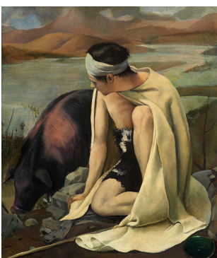
Baccio Maria Bacci Il figliol prodigo 1925 olio su tela, 70,5 x 60 cm Museo del Novecento, Milano