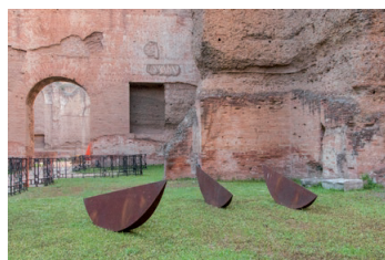
6. Senza titolo , 1993 acciaio corten 55x250x20 cm ciascuno tre elementi Archivio Mauro Staccioli, Volterra