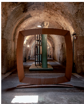
21. Cerchio imperfetto , 2014 acciaio corten 242x234x60 cm Archivio Mauro Staccioli, Volterra