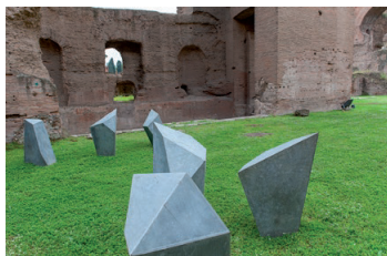
12. Prismoidi , 2003 ferro zincato 110x70x80 cm ciascuno undici elementi Archivio Mauro Staccioli, Volterra