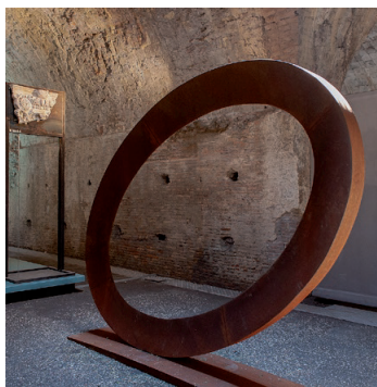
15. Senza titolo (Ellisse) , 2009 acciaio corten 220x261x52,5 cm Archivio Mauro Staccioli, Volterra