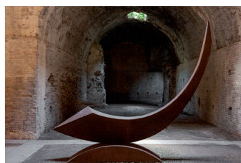
24. Seogwipo '14 , 2015 acciaio corten 250x300x47 cm Galleria Open Art, Prato